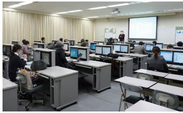
FDのための情報技術研究講習会

毎年2月下旬に私立大学の教員を対象に情報通信技術活用能力の習得を目指して「FD（組織的な教員の教育指導能力の開発）のための情報通信技術研究講習会」を開催して大学教員の教育技術力の支援を行っています。