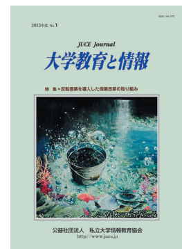
機関誌「大学教育と情報」

公益目的事業に対する理解の促進及び普及をはかるために、機関誌「大学教育と情報」の発行を年4回、全国の大学、政府、関係機関等向けに発行しています。また、インターネット上で事業の経過及び成果を随時情報公開するとともに、意見の収集を行い、事業の見直しなどに反映できるようにしています。また、九州地域、中・四国・関西地域、中部地域、東北地域、北海道地域にて事業報告交流会を実施して、事業への理解促進及び意見をうかがい、事業の改善に反映するようにしています。