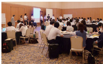
大学職員情報化研究講習会

私立大学の職員を対象に「大学職員情報化研究講習会」を毎年7月と12月に開催し、情報通信技術を活用した教育・学修支援のマネジメント、人材育成支援、IR(大学機関による教育・経営の自己診断調査活動)、業務運営などへの関与の仕方を研修し、職員の職務能力の強化促進に努めています。