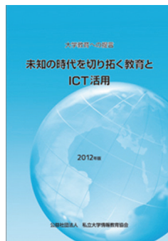
大学教育への提言

3年間隔で加盟校の全教員約5万6千人を対象に「私立大学教員の授業改善調査」を実施し、教育の質的転換に向けて教育改善に対する教員の受け止め方を把握し、どのように対応していくべきか、今後の課題を整理・提言し、大学、文部科学省、関係団体等に施策への反映を呼びかけています。平成25年度に調査を実施し、その結果を「私立大学教員の授業改善白書」としてネット上で公開しています。