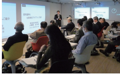
教員の企業現場研修