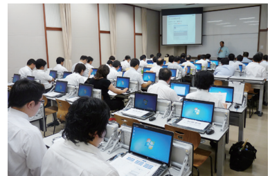
大学情報セキュリティ研究講習会

大学が所有する情報資産を安全に管理・運用できるよう情報セキュリティ対策の危機管理能力の強化を推進するため、毎年8月下旬に私立大学を対象に「大学情報セキュリティ研究講習会」を開催し、情報資産の適正管理に関する専門知識及び防御戦略を探求するとともに、災害対策などから情報資産、金融資産を守るリスクマネジメント等の管理技術の普及に努めています。