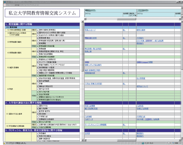
大学間情報交流システム