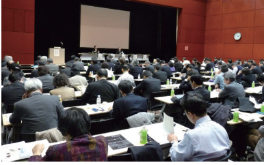
産学連携人材ニーズ交流会