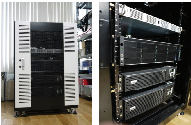
高速ストレージシステム（外観と内観）

ストレージには、先生や学年ごとの学生、スタッフなどでアクセスできるエリアを制限してコンテンツデータの安全な取り扱いを実現しています。それぞれのユーザー、パスワードでログインすれば使用できるエリアのみ自動でデスクトップにマウントされるように設定しているためユーザー側は、制限エリアを意識することなくアクセスできるようになっています。