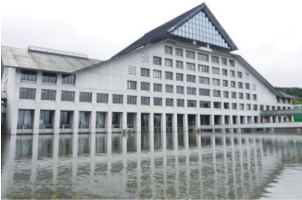
東北芸術工科大学

～学校法人東北芸術工科大学へ最新Mac 高性能ストレージ及び高速ネットワークを導入～