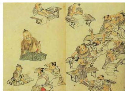
渡辺華山画「寺子屋の図」(田原町教育委員会蔵)