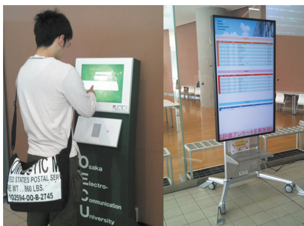
KIOSK端末と60インチ大型ディスプレイ

大阪電気通信大学では、2011年10月1日に開学50周年を迎え、より充実した学生サービスを実現する為に、デジタルサイネージ・KIOSK端末を使った情報配信システムを導入しました。