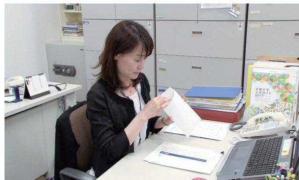
年間8千件を超える郵送での申請に、職員が手作業で対応

一方、大学職員の負担も小さくありません。郵送による証明書発行枚数は近年、増加傾向にあり、2015年度には8千枚を超えています。その申請に対し、職員が一件一件、手作業で対応していました。