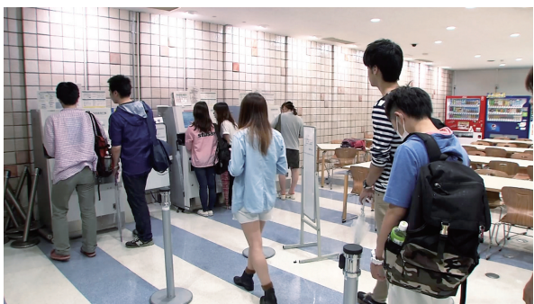
就職活動期には発行機の前に長蛇の列が

こうした証明書は、大学の窓口や学内の証明書発行機を利用して取得するか、郵送で取り寄せるしかなく、就職活動シーズンには、発行機の前に行列ができる状況でした。