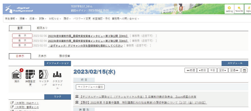
ポータルサイト画面

システム選定の方針として、「学生と教員へ安定した学内プラットフォームを提供したい」、「学生と教員の利便性を向上させたい」、「職員の業務効率化を図りたい」という考えに基づき、システム構成や各社プロダクトを比較検討の結果、大学の質向上をプラットフォーム側からも下支えできると期待しGAKUENシリーズの導入が決定しました。