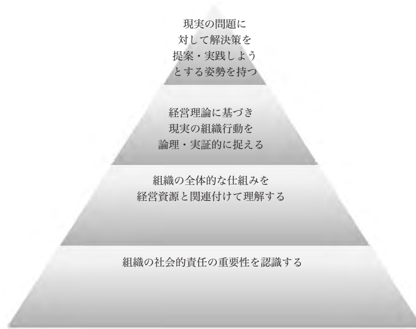
図 学士カピラミッド

第一に企業をはじめとする組織の社会的役割と責任の重要性について認識できること、第二に企業をはじめとする組織の全体的な仕組みを経営資源と関連付けて理解できること、第三に経営理論に基づき現実の組織行動を論理・実証的に捉えられること、第四に企業をはじめとする組織の一員として、現実の問題に対して解決策を提案・実践しようとする姿勢を持つことができるとした(図)。